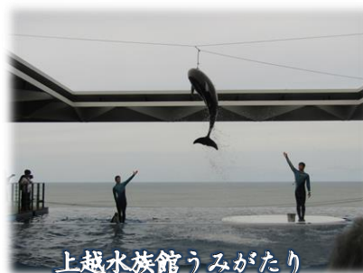
上越水族館うみがたり